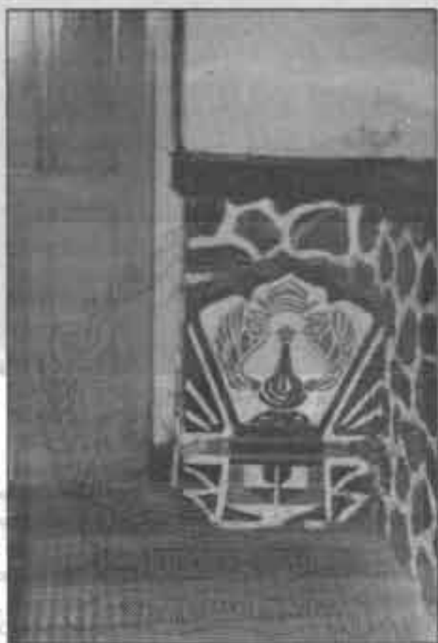
Komplek Pentinggalan Nyi Begelan