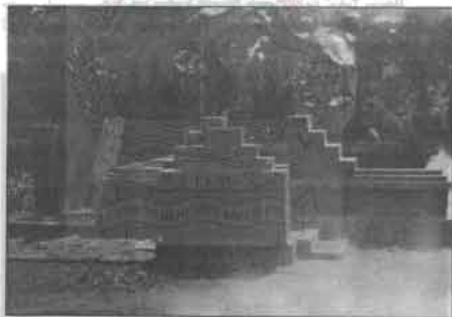
Komplek Sumur Mbeji Desa Banyuurip