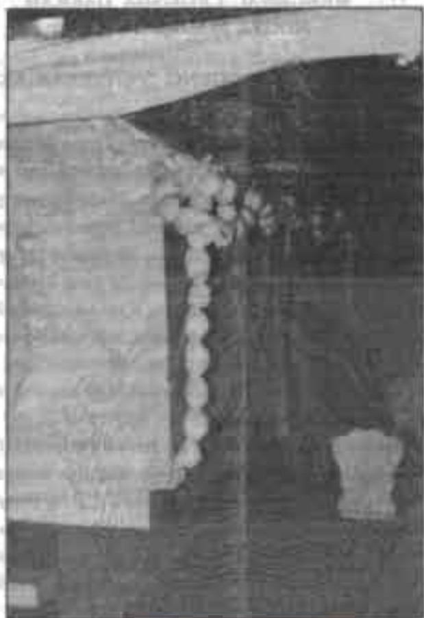
Makam Sunan Kediri di Gribig