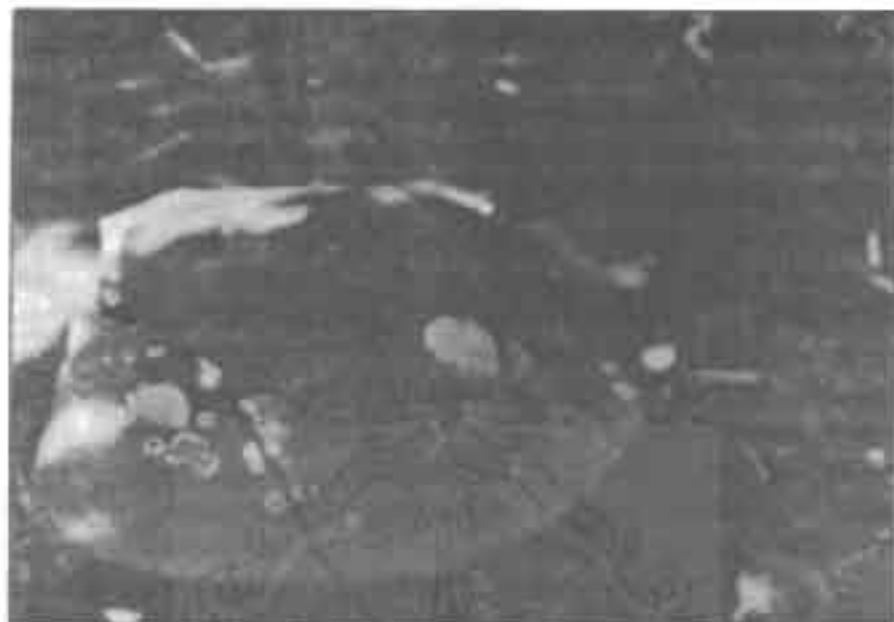
Ompak Batu Pentinggalan Nyi Begelan