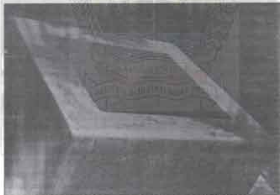
Sumur Beji asal mula terjadinya Desa Banyuurip